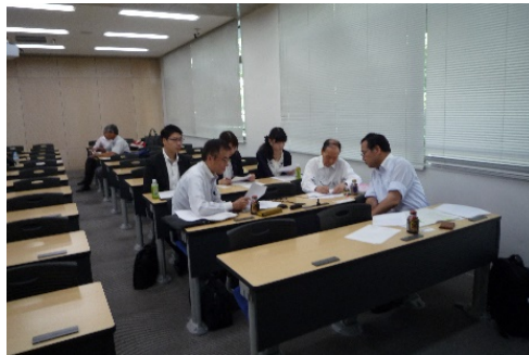
設計手法研究部会