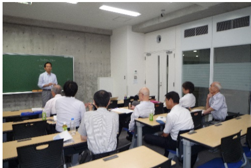
設計管理研究部会

第二部は、2017年度第2回目の研究部会活動を行いました。各研究部会ごとにメンバーで「具体的な課題を定義」することを目的に討議を実施しました。